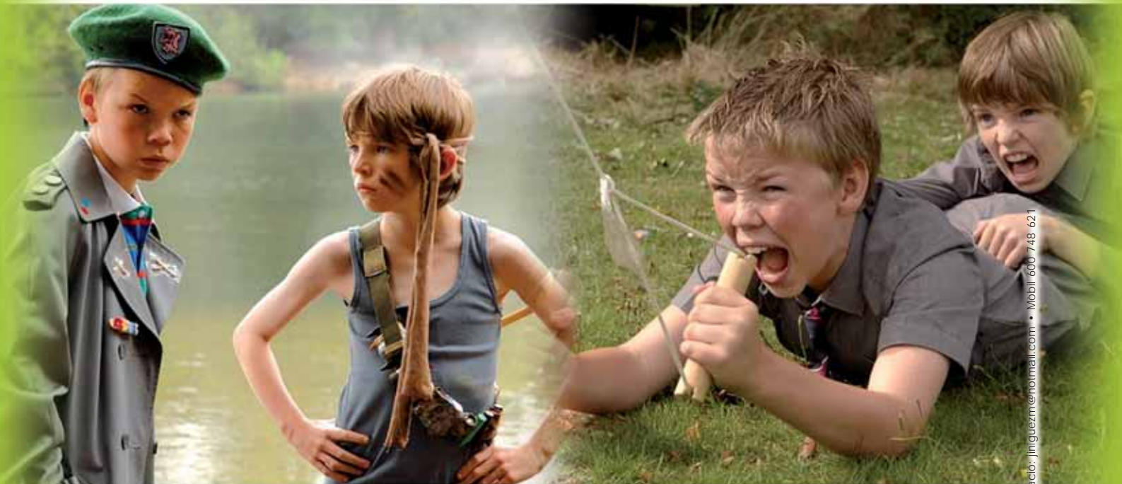
Guió elaborades per Setmana del Cinema Espiritual.

ORGANITZEN: Delegacions de Joventut de Barcelona, Terrassa, Sant Feliu de Llobregat, Vic, Tarragona, Girona, Lleida, Mallorca i Menorca.